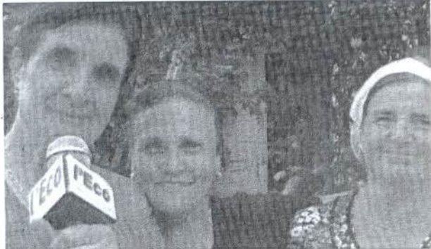
Il gruppo affiatato delle cuoche di Senise