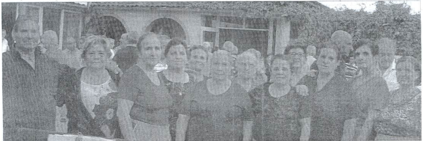
Una parte degli associati di "Argento vivo"

Sicuramente la pasta fatta in casa e anche, i secondi a base di carne.