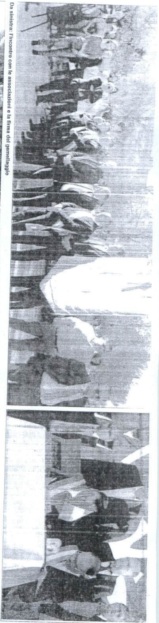
Da sinistra: l'incontro con le associazioni e la firma del gemellaggio