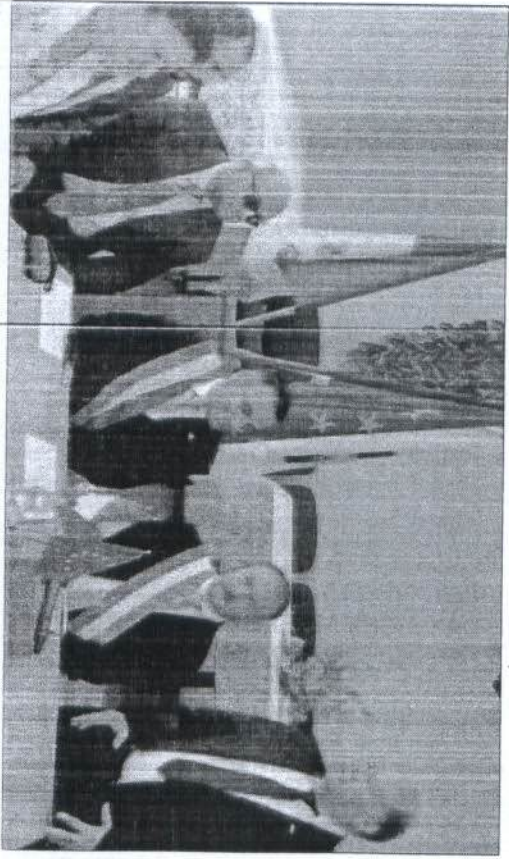
Un momento dell'incontro ufficiale. A destra la delegazione lucana in una scuola